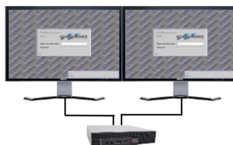
DELL OptiPlex 9020 Micro 2-fach Lösung