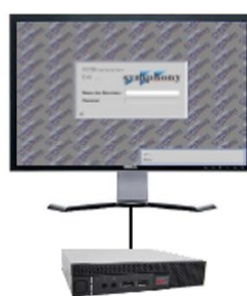
DELL OptiPlex 9020 Micro 1-fach Lösung